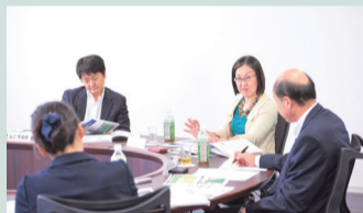
ステークホルダーダイアログの様子